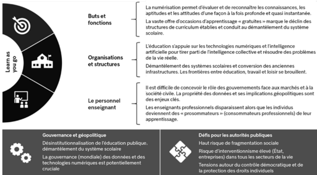
Figure 1 Le scénario « Learn-as-you-go » évoqué par l'OCDE

SOURCE : traduit de OCDE, « 4. The OECD Scenarios for the Future of Schooling », Back to the Future of Education : Four OECD Scenarios for Schooling , graphique 4.5, Paris, Éditions OCDE, 2020, www.oecd-ilibrary.org/sites/7c2c1b9g-en/index.html?itemId=/content/component/7c2c1b9g-en .